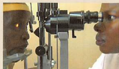
③現在のLCIF交付金による様々な奉仕活動の実態