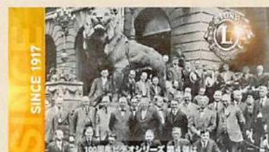
①ライオンズ国際協会100年の歩み