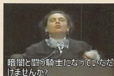
②1925年国際大会における「ヘレンケラー」のスピーチ