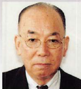
地区名誉顧問・元地区ガバナー (1982-83年度地区ガバナー)

永年に渉るクラブ活動ありがとうございました。ご冥福をこころからお祈りいたします。