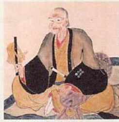
真田昌幸画像

この上田城を築いたのは、幸村の父・昌幸。こちらにも多くの逸話や勇猛譚を残す名將として名高い。