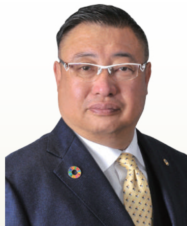
1963年6月、諏訪市生まれ。86年から南増澤印刷所を営み、2002年9月に諏訪湖ライオンズクラブ入会。この間、クラブ幹事、テールツイスターなどを経てクラブ会長を歴任。ライオンズクラブ国際協会334-E地区第2、第1副地区ガバナーから2021-22年度地区ガバナーに就任。また、地域では諏訪市議会議員を2期8年務め、決算特別委員長、社会文教委員長などを歴任している。

この大変な時期を皆さんと心一つにして行動すれば思いが叶うと信じております。一年間よろしくお願ひ致します。