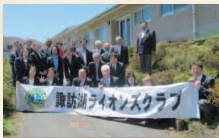
献眼碑法要例会 2019・6・5