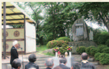
児童養護施設つづが丘学園訪問例会 2019・5・8