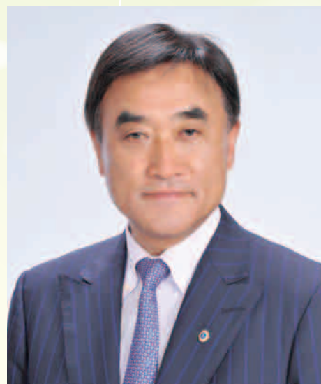
ライオンズクラブ国際協会 334-E地区