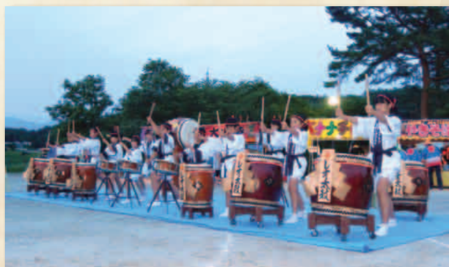
三施設合同納涼祭