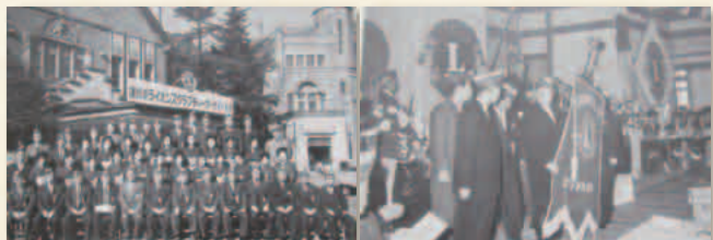
チャーターナイト式典

ライオンズクラブ創設に賛同を得られると思われる者の名簿を作成し、諏訪・岡谷両市の諸氏を訪ね歩き、ライオンズクラブなるものを説明、賛同を得て集まった19人が、その後の諏訪湖LCチャーターメンバーとなる。