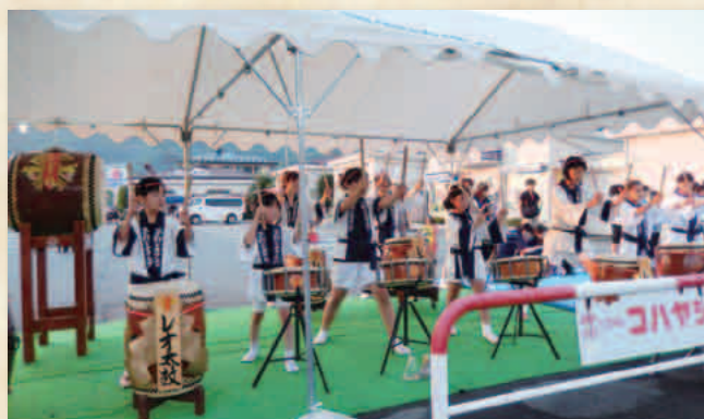
茅野どんぱん祭り