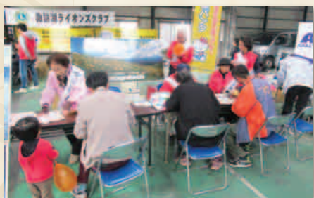
献眼・骨髄バンク登録推進活動 2018・11・4